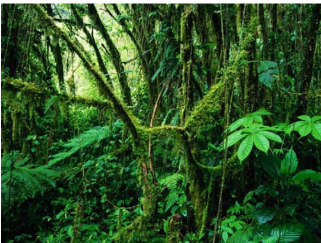
Fig. 3 Foresta pluviale

Suolo: a livello del terreno la foresta è umida e buia, ma questa è la zona più vitale. Qui infatti, grazie all'azione dei decompositori, dalle foglie secche, dagli alberi morti, dai resti di piante e animali, vengono create le sostanze nutritive necessarie alla crescita delle piante. Vivono qui termiti, funghi, tarantole formiche e formichieri.