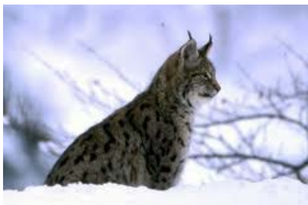
Fig. 2 Lynx lynx