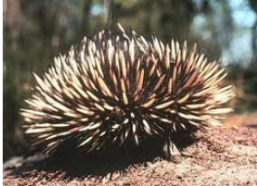
Fig.7 Tachyglossus aculeatus

L'aculeo è, nel linguaggio scientifico, il nome generico di ogni organo pungente che si trova negli animali con la funzione di protezione. Nei mammiferi sono generalmente produzioni epidermiche, cioè peli modificati come nel caso del riccio, istrice ed echidna. L'echidna (Fig.7), mammifero australiano, si trasforma in una palla di aculei se il terreno è duro, mentre se il terreno è morbido, scava una buca nel terreno lasciando in superficie solo gli aculei.