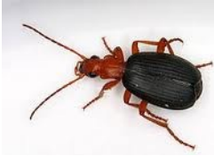
Fig.4 Brachinus sp.

Le seppie e i polpi presentano delle ghiandole, all'interno del loro corpo, che emettono una nube di inchiostro che li nasconde alla vista dei loro nemici. Anche molti insetti sono in grado di sintetizzare sostanze chimiche per allontanare ospiti indesiderati. Un esempio è dato dai coleotteri bombardiere (Fig.4) che, se disturbati, espellono in modo esplosivo un miscuglio di sostanze, prodotte da speciali ghiandole addominali, emettendo un boato.