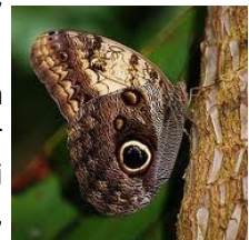
Fig.2 Caligo memnon

Anche le due macchie circolari, detti "ocelli", che adornano le ali della farfalla gufo (Fig.2), diffusa in Sud America hanno una simile funzione. Per alcuni esperti queste chiazze servirebbero a spaventare lucertole e piccoli uccelli, che sono ghiotti di questo lepidottero. Vista a "testa in giù" infatti, questa farfalla forma con le ali una figura che sembra la faccia di un temibile gufo.