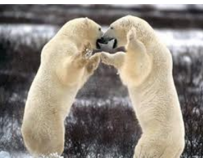
Fig.6 Ursus maritimus

Gli artigli sono una versione più forte e affilata delle nostre unghie. I felini li usano per afferrare e tenere la preda prima di ucciderla con i denti o per attaccare e difendersi durante gli scontri con altri simili. Gli orsi polari (Fig.6) catturano le foche con gli artigli delle zampe anteriori ma li usano anche nei combattimenti tra maschi. Il falco pescatore piomba dal cielo e afferra i pesci con le sue forti zampe e li infilza con gli artigli.