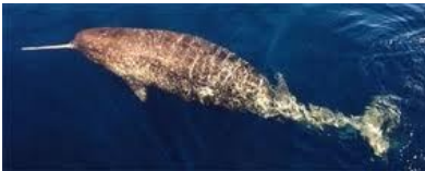
Fig.5 Monodon monoceros

I denti possono essere di diverse forme e dimensioni in base alla loro funzione. I vertebrati usano i denti per cacciare, mangiare le prede e difendersi.