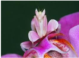
Fig.1 Hymenopus coronatus

Il camaleonte per non essere predato e per non farsi vedere dalle sue prede riesce ad assumere delle colorazioni molto simili all'ambiente in cui vive.