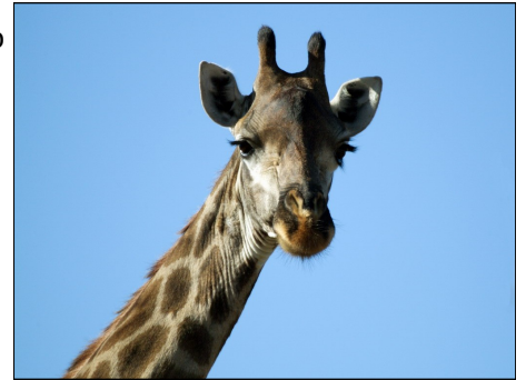
Fig.3 Giraffa camelopardalis