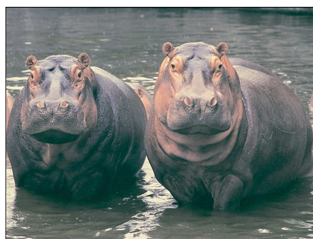
Fig.1 Hippopotamus amphibius