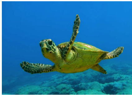
Fig.9 Tartaruga marina