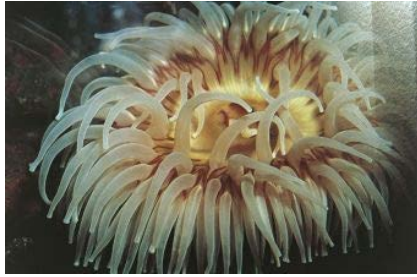
Fig.3 Anemone di mare