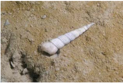
Fig.5 Turritella communis