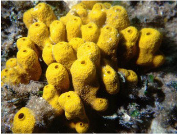
Fig.2 Spugna di mare