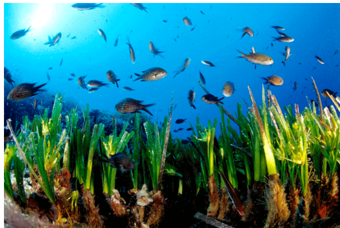
Fig.1 Posidonia oceanica

Nell'ecosistema costiero del mar Mediterraneo un ruolo fondamentale è svolto dalla Posidonia oceanica . Grazie al suo sviluppo fogliare produce un'alta quantità di ossigeno, fino a 20 litri al giorno per ogni metro quadrato di prateria. Questa pianta oltre a contribuire al consolidamento dei fondali e delle spiagge, proteggendole dall'erosione, crea delle vere e proprie nursery per le specie ittiche (Fig.1).