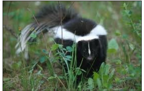
Fig.4 Mephitis mephitis

Gli animali che utilizzano colori aposematici sono tossici o velenosi, oppure hanno semplicemente un sapore sgradevole per le specie che potrebbero utilizzarli come nutrimento. I colori vistosi sono un modo di ricordare ai possibili predatori le conseguenze dell'ingestione, o anche solo di un assaggio dell'animale che utilizza il mimetismo di tipo mulleriano. La colorazione ha quindi il vantaggio di allontanare il predatore ancora prima che incominci il suo attacco, con evidente beneficio della preda per la quale, a volte, anche un semplice morso potrebbe essere fatale. Si è osservato che i colori aposematici utilizzati dalle varie specie sono pochi: i colori principali sono il giallo, il rosso, l'arancio e l'azzurro, in genere collocati su uno sfondo tale da esaltare il contrasto come nero o bianco.