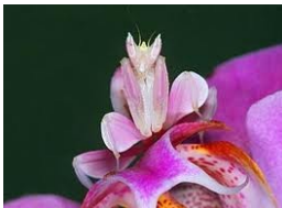
Fig.1 Hymenopus coronatus

Il camaleonte per non essere predato e per non farsi vedere dalle sue prede riesce ad assumere delle colorazioni molto simili all'ambiente in cui vive.