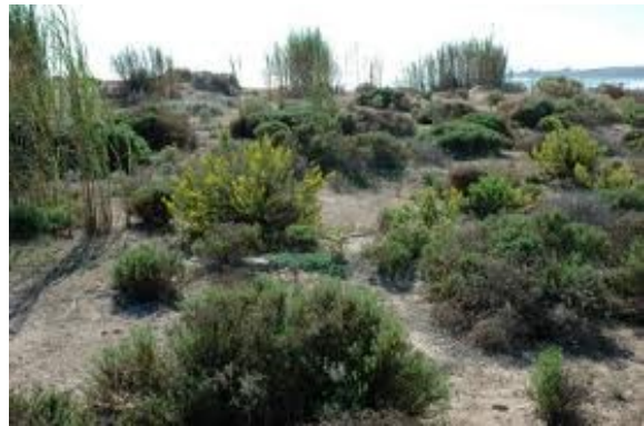
Fig.4 Macchia mediterranea

Questo tipo di ambiente è caratterizzato da estati calde e secche e da inverni miti e piovosi. Questo influenza notevolmente la vegetazione, che è quindi caratterizzata da piante basse, legnose, perenni, a struttura di tipo sclerofitico, cioè con foglie piccole e dure adattate a resistere alla siccità estiva. Per questo motivo la macchia mediterranea è chiamata anche "foresta a sclerofille". La piovosità totale annua è di circa 250-500 millimetri e interessa soprattutto i mesi invernali. In estate la temperatura media mensile è spesso superiore ai 20 °C e in inverno il gelo è molto raro. Questo ambiente è abitato da cinghiali, caprioli, daini, scoiattoli, volpi, lupi, tassi, roditori, testuggini, lucertole e molte specie di uccelli. La fauna del suolo comprende chiocciole, insetti e lombrichi che in inverno vanno in letargo mentre in estate vanno in estivazione per proteggersi dall'eccessivo caldo.