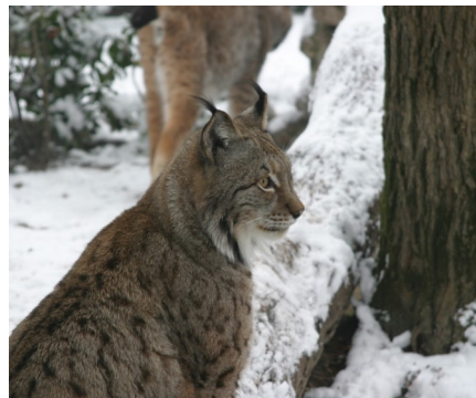
Fig.8 Linx linx

Questo habitat è dominato dagli alberi sempreverdi di conifere come abeti e pini, che hanno foglie aghiformi e producono semi racchiusi in coni (comunemente chiamati pigne). Questa foresta ricopre vaste aree dell'emisfero settentrionale, tra i 50 e i 60 gradi di latitudine, dove è nota anche con i nomi di taiga o foresta boreale . Questa area è caratterizzata da un clima piuttosto rigido di inverno (anche -30°C) e fresco in estate (si possono raggiungere al massimo i 20°C). Tra i mammiferi che abitano queste foreste troviamo volpi, linci (Fig.8), orsi, lupi, visoni, renne ed alci. Le specie che non vanno in letargo possiedono degli adattamenti particolari per spostarsi agilmente sulla neve. La renna e l'alce, ad esempio, hanno zoccoli grossi e piatti per poter distribuire meglio il loro peso. Zampe con adattamenti simili si trovano anche nella lepre artica, nella linca e nel gallo cedrone.