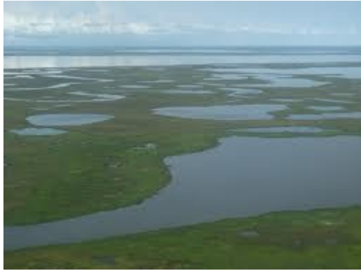
Fig.9 Tundra in Alaska nei mesi estivi

La tundra artica dell'Eurasia e dell'America settentrionale si estende sopra i 55 gradi di latitudine ricoprendo un quinto delle superficie del pianeta. E' caratterizzata dal cosiddetto permafrost, cioè il terreno ghiacciato, che può raggiungere un centinaio di metri di profondità. La sua formazione è dovuta alla scarsa energia solare che raggiunge il suolo. Il sole infatti, durante i mesi invernali, rimane al di sotto dell'orizzonte mentre d'estate non tramonta mai, perché si alza molto in alto nel cielo. Le precipitazioni piovose e nevose annuali sono decisamente scarse, così come i nutrienti. La tundra artica si estende su vasti territori pianeggianti o ondulati, privi di alberi e con il suolo saturo d'acqua durante i mesi estivi.