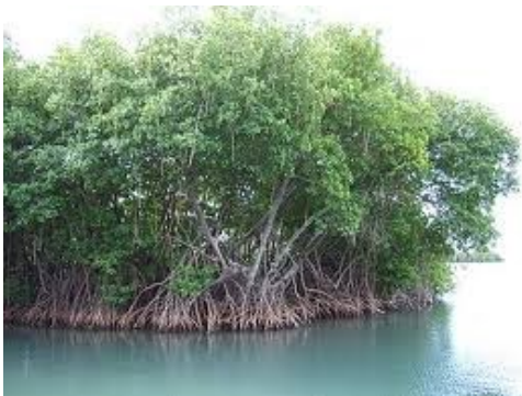
Fig.1 Foresta di mangrovie

Le mangrovie stabilizzano le linee di costa nei delta e negli estuari dei fiumi, e lungo le coste delle zone tropicali e subtropicali. Quasi tre quarti delle coste tropicali sono caratterizzati da questo tipo di habitat, dominato da piante con radici poco profonde e resistenti ad un'elevata salinità.