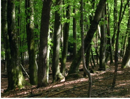
Fig.6 Foresta a prevalenza di Fagus sylvatica

Si trovano in tutto il mondo a latitudini comprese tra i 25 e i 50 gradi e di solito sono dominate dalle latifoglie. In Nord America, Asia orientale ed Europa occidentale, dove gli inverni sono freddi e gelati, queste foreste sono decidue e ci sono quattro stagioni ben definite. Per superare i rigori invernali molti animali vanno in letargo o migrano. In Sud America, Cina meridionale, Nuova Zelanda, Australia orientale, Giappone e Corea gli inverni sono invece più miti e gli alberi dominanti sono sempreverdi.