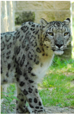
Fig.7 Uncia uncia

In questi ambienti le condizioni climatiche variano con l'altitudine, e le forme di vita si distribuiscono a livelli diversi. L'aria si raffredda man mano che si sale e anche le cime di montagne tropicali come il Kilimangiaro possono essere perennemente innevate. Nelle regioni montuose vivono mammiferi grandi e agili come i camosci e i leopardi delle nevi (Fig.7), ma anche animali più piccoli che solitamente vanno in letargo per far fronte ai rigori del clima.