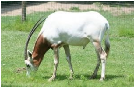
Fig.3 Oryx dammah

Questi habitat coprono quasi un terzo del pianeta e sono caratterizzati dall'assenza di umidità dovuta da un'elevata evaporazione, scarse precipitazioni, o a una combinazione dei due fattori.